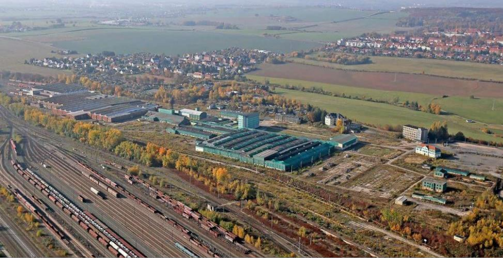
Standort der geplanten JVA Zwickau