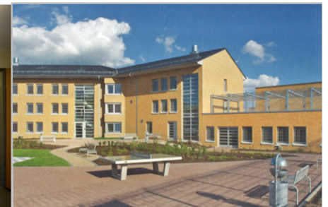
Innenhof für Sicherungsverwahrte