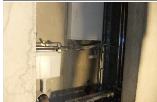
Installation im Zellenschacht