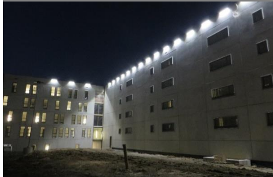
Fassaden- und Hofbeleuchtung