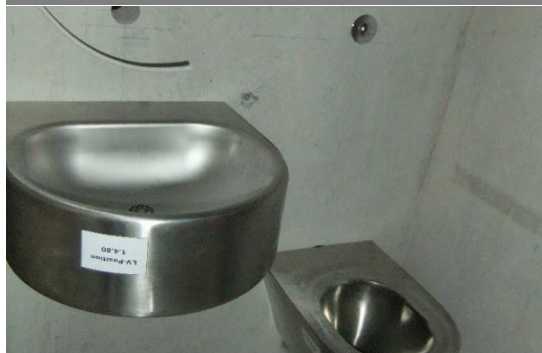
Sanitärinstallation in Zelle mit erhöhten Sicherheitsanforderungen