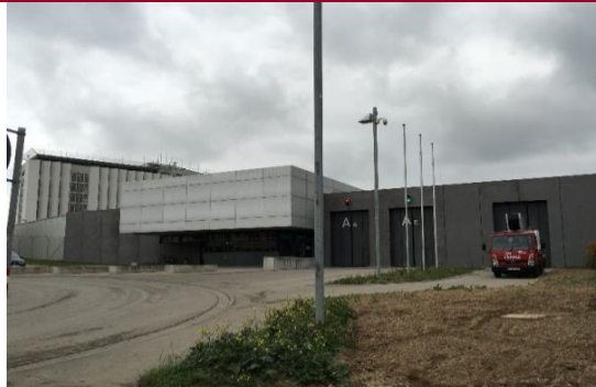
Torwache im Bestand