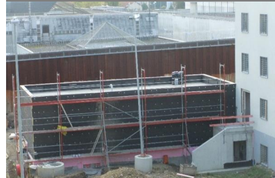
BHKWs in der Heizzentrale